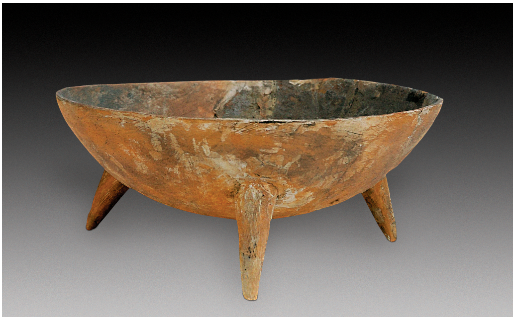
图10 陶三足钵，新石器时代中期。高8厘米，口径25厘米。1978年磁山文化遗址出土