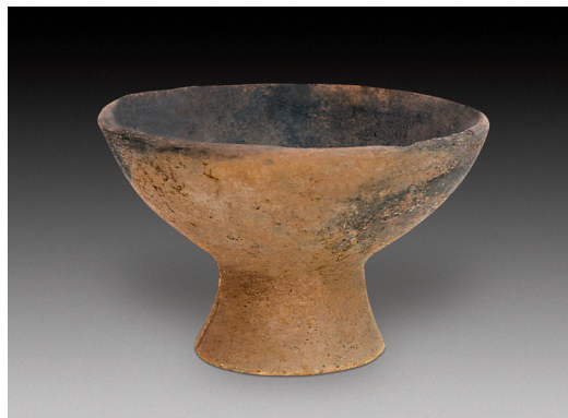
图9 高圈足陶豆，新石器时代中期。高9.3厘米，口径14.5厘米，底径7厘米。1978年武安磁山村东出土

陶器的发明，不仅使人们方便地烧煮各种食物，对人类体质的增强和智慧的提高产生了巨大的影响，而且人们因有了多种取水、储水器具而不必依河而居，从而开阔了活动场所，拓展了生活空间。磁山人制作的陶器已有煮食器陶孟、支脚，盛食器豆、钵、碗及酿酒器小口壶等多个品种。日常生活用具的大量出土，为我们研究人类的生活方式、习俗以及饮食文化的发展等问题，提供了直接的实物资料。其中，高圈足陶豆在我国新石器时代中期考古中，仅见于磁山文化遗址（图9）。另外，这里还出土多件带三足的器物，表明了磁山先人早已掌握了三点稳定性的原理，并实际应用于日常生活之中，体现了他们探索实践的智慧 and 创造力。如陶三足钵，为大敞口圜底浅盘式，腹壁部有外撇的三只锥形足，是磁山文化中很有特色的盛食器（图10）。陶三足器，其造型为微敛口深长腹圜底结构，底部也有外撇的三足（图11）。再有陶碗的发现，也让我们真实地看到了史前人类的食饭用具。碗是用夹