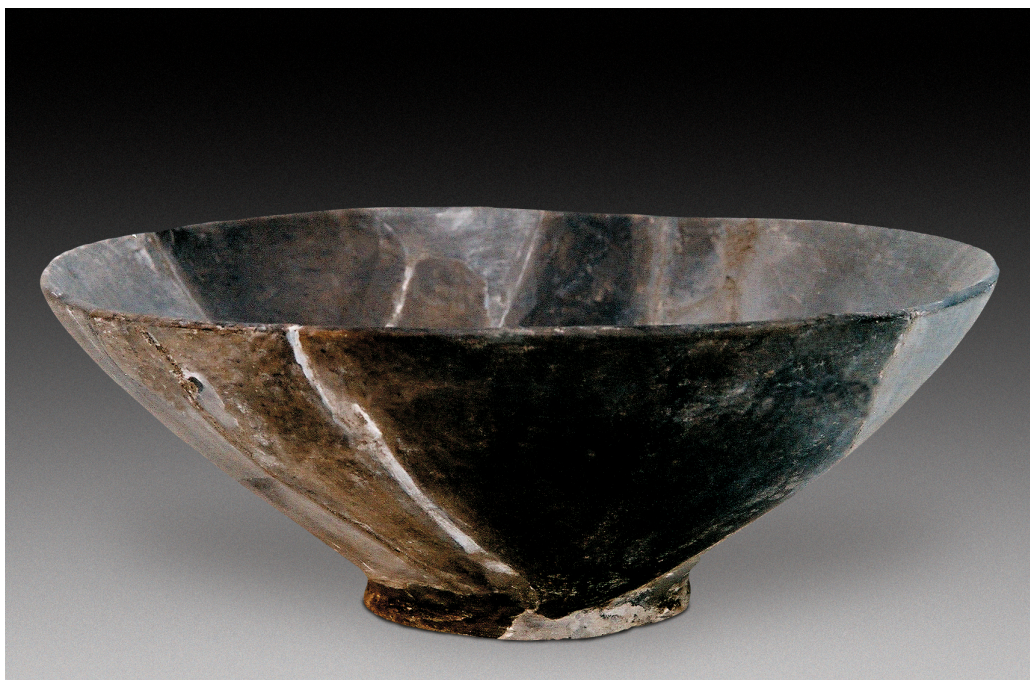
图12 陶碗，新石器时代中期。高9厘米，口径25厘米。1978年磁山文化遗址出土

折，长颈，折肩，折腹，肩腹部两侧各有一耳，小平底，均为素面。经研究，磁山的这种陶壶极有可能是原始的陶质酒壶。因为邯郸境内的界段营仰韶文化遗址出土的小口壶、赵窑仰韶文化遗址出土的小口平底瓶，已被专家学者认为是当时酿酒的酒壶。而磁山小口壶与其时代连贯、地域相同、造型相似，而且当时已有大量的剩余的粮食作物可供酿酒之用，所以说，当时的磁山文化时期已具备了基本的谷物酿酒的条件。由此看来，磁山的这种小口陶壶对我国酿酒起源和酒文化历史的探索研究是具有重要意义的（图14）。