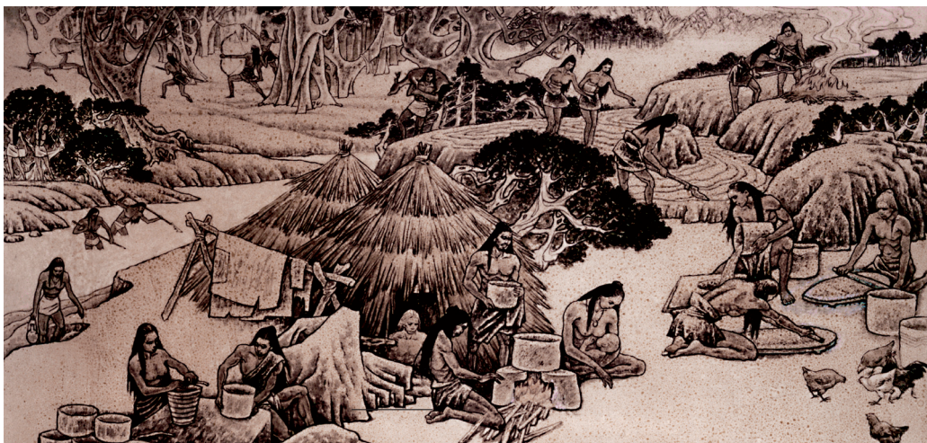
图4 磁山文化房址复原图

从发掘遗址看，当时磁山人的房屋呈圆形或椭圆形的半地穴式，房屋地面距地表约有半米多深，房址面积为6~7平方米。部分房址有二至三级台阶或伸向坑外的斜坡式门道，柱洞分布在坑口边缘，有的在坑内。居住面和内壁都未经进一步加工处理，当时的建筑结构还比较简单。据专家研究，这种房屋的建筑程序是，先用树枝搭置房屋的骨架，再用草拌泥里外堆筑形成房墙，用芦苇、荆芭等较细软的植物来苫盖房顶，形成外观状如馒头的屋顶，同时在房门的出口处留出台阶，供人们出入房屋（图4）。