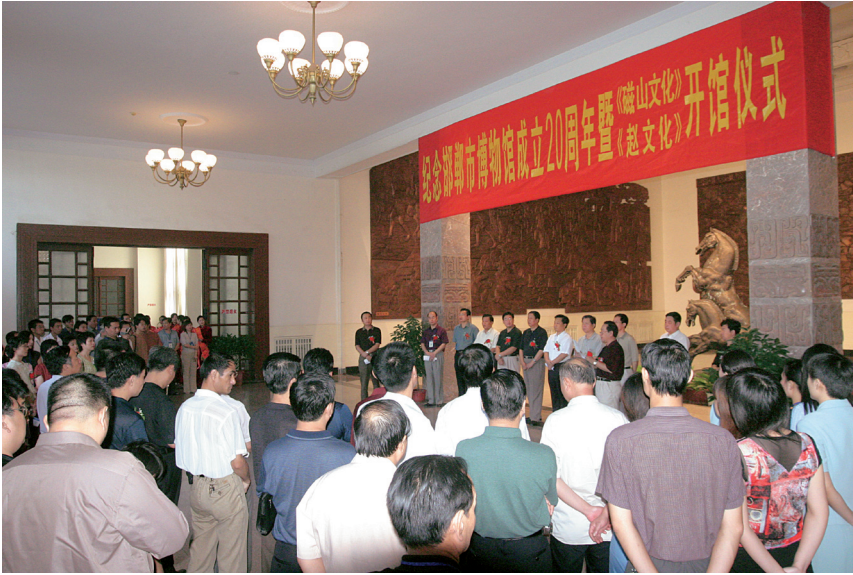
2004年8月庆祝邯郸市博物馆 成立20周年仪式 Ceremony for congratulating the 20th anniversary of the establishment of the Museum of Handan