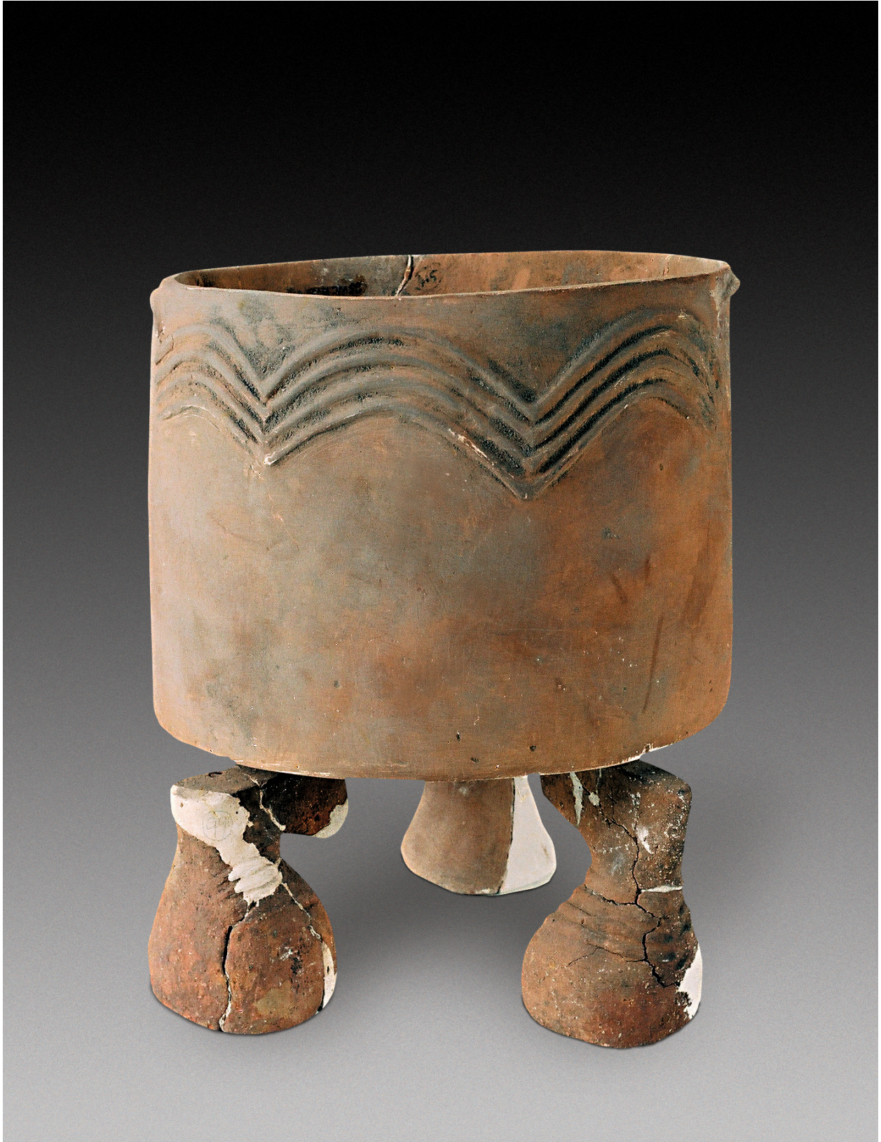
图13 陶盂和陶支脚，新石器时代中期。盂，高17.8厘米，口径19.5厘米；支脚，高13.2厘米，底径18.4厘米。1978年磁山文化遗址出土