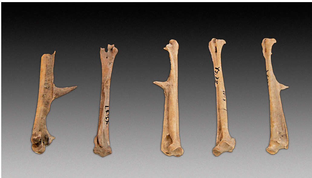
图7 家鸡骨，新石器时代中期。长7.96厘米。1978年磁山文化遗址出土

渔猎和采集活动是史前人类最重要的生产和生活方式，伴随着人类发展走过了极其漫长的岁月。虽然磁山人已开始从事原始农业生产这一新型生产方式，但同时仍保持着传统的大规模的渔猎和采集活动。他们把鱼镖嵌绑在长柄上，到河边叉鱼，还撒网捕鱼。在山林中，他们用木棒敲打、投掷石块、手摘等方式采集野果。除围猎外，他们还善于借助石球、弹弓、弓箭等捕获飞禽走兽，有时也用家犬助猎。从遗址出土的动物标本看，他们捕食的动物有兽、禽、鱼等23种之多。这里展出有当时的鱼镖。虽然鱼镖种类很多，使用方法不一样，但作用是相同的。有的鱼镖直接被固定在镖杆上，还有的鱼镖通过尾部的孔、凹槽用绳索系在镖杆上。刺鱼