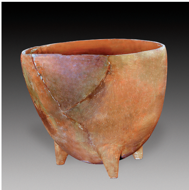
图11 陶三足器，新石器时代中期。高22厘米，口径30厘米。1978年磁山文化遗址出土