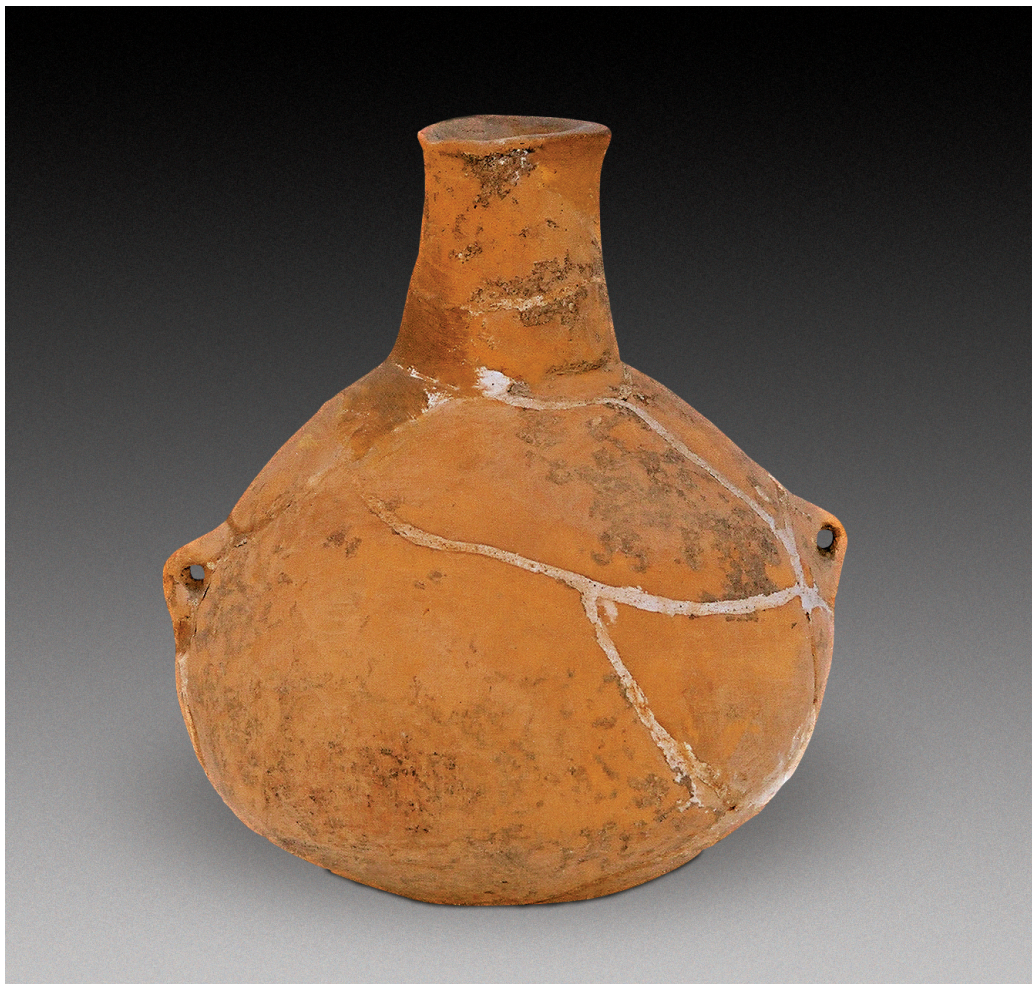
图14 小口长颈双系陶壶，新石器时代中期。高18厘米，口径5厘米。1978年磁山文化遗址出土

Small-mouthed long-necked pot with two handles, mid Neolithic