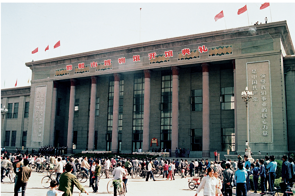
图3 邯郸市博物馆开馆仪式