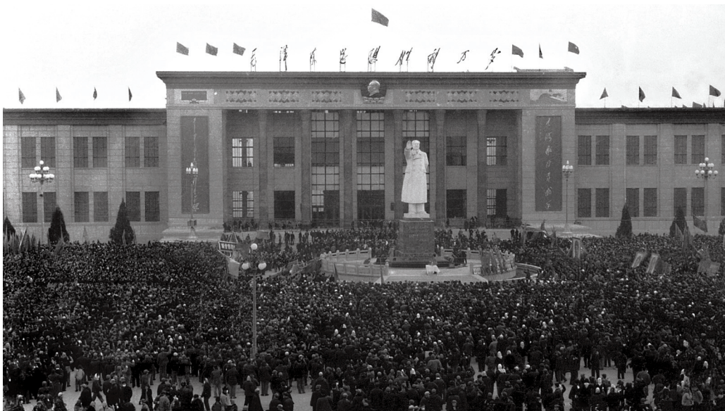
图2 河北省文物保护单位“毛泽东思想胜利万岁”邯郸展览馆外景

Outer scene of Handan exhibit centre of long live Mao zedong' s thought