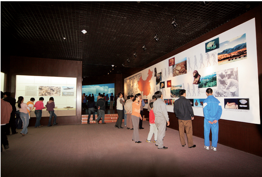
邯郸市博物馆实行未成年人免 费，每年5次向社会免费开放 'Free of charge' for young aged people; five exhibitions each year totally 'free of charge' to all visitors