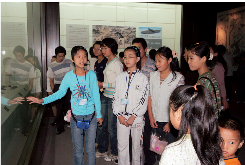
“小小志愿者”在未成年人教 育活动中发挥作用 Young Volunteers Activities play a significant role in Museum education